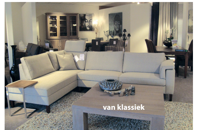
GROTE COLLECTIE HOEKBANKEN