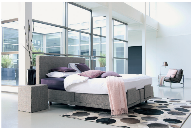
SLAAPKAMERS, WANDKASTEN, DRESSOIRS

ALLES COMBINEREN OP ÉÉN ADRES VOOR HET MOOISTE RESULTAAT